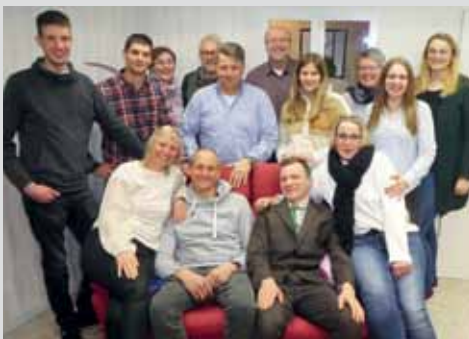
MTV Nordel lädt ein zum Theater Seite 14