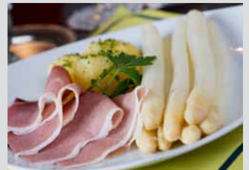
Saisonstart auf Spargelhof Winkelmann am 1. April Seite 16