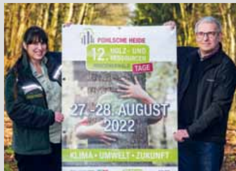
Holz- und Ressourcentage Mindenerwald Seite 15